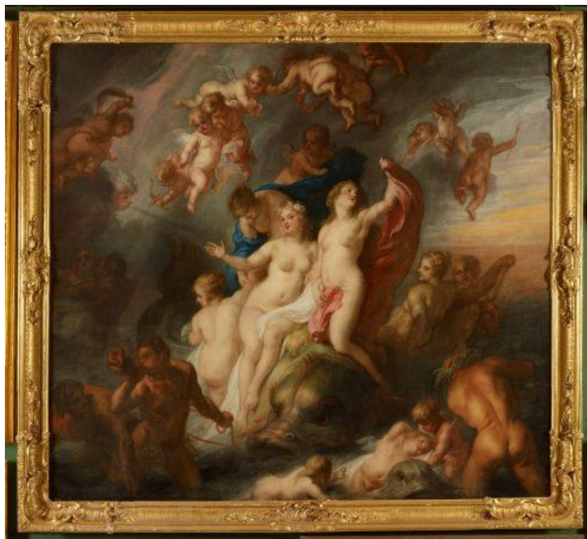
Theodoor van Thulden, Triumph der Galatea, 1659, Öl auf Leinwand, 272,50 x 300,00, GK I 10632