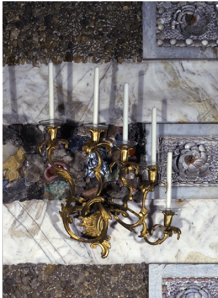
Abb. 2, Metallwarenfabrik Carl Schlösser, Wandbranche, Potsdam, Neues Palais, Grottensaal, R. 177, Potsdam 1890, Bronze (Messing), feuervergoldet, Inv. Nr. VIII 404, 27 x 55 x 23 cm

Mode. Erst Kaiser Wilhelm II. wieder fand an ihnen wieder Gefallen und ließ neben neuen auch Kopien der historischen Wandbranchenmodelle anfertigen (siehe Abb. 2). 7