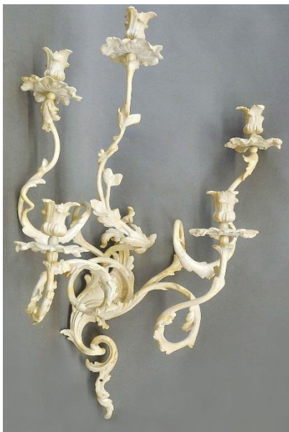
Abb. 4, Johann August Nahl d.Ä. (Entwurf), Wandbranche, Potsdam, Neues Palais, Königswohnung, Fleischfarbene Kammer, R. 180, Berlin/Potsdam um 1765, Bronze (Messing), weiß lackiert, Inv. Nr. VIII 488, 42,5 x 20 x 49 cm.

Hinweise auf die Entstehungszeit können auch Gewinde geben, wenn diese nicht bei späteren Elektrifizierungen oder „Überarbeitungen“ durch neue, metrische Gewinde ersetzt, oder bei Kopien alte Gewinde eingefügt wurden, so dass auch dieses Unterscheidungsmerkmal fragwürdig sein kann. Nur die umfangreiche Kenntnis des Materials, dessen Verarbeitung und der Geschichte der Räume, in denen die Leuchter hingen, kann im Zusammenspiel mit den Quellen zur Erkennung von Unterschieden führen, so wie auch eine klare Zuordnung einzelner Objekte in schriftlichen Quellen nur bei einer lückenlosen Provenienz möglich ist. Bei dem Material Messing kommt überdies erschwerend dazu, dass häufig für den Guss Altmaterial mit eingeschmolzen wurde, was eine Datierung anhand einer naturwissenschaftlichen Analyse der Materialzusammensetzung unmöglich macht. Dies bedeutet, dass selbst die Wandleuchter, die in der Regierungszeit Friedrichs bis etwa 1768 immer wieder nach gleichem Modell gefertigt wurden (siehe Abb. 3, 4, 5) nicht von den ersten Ausführungen der Jahre zwischen 1742 und 1745 unterschieden werden können. Eine eindeutige Bestimmung ist hier nur möglich, wenn sie an ihren ursprünglichen Hängeorten verblieben sind und schriftliche Belege existieren.