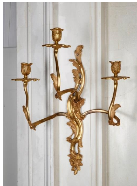
Abb. 5, Johann August Nahl d.Ä. (Entwurf), Wandbranche, Potsdam, Schloss Sanssouci, Audienzzimmer, R. 118, Berlin/Potsdam um 1745, 1742 erstmals für die Goldene Galerie in Schloss Charlottenburg gefertigt, Bronze (Messing), feuervergoldet, Inv. Nr. VIII 85, 43 x 56 x 40 cm. Fotonummer F0019338.