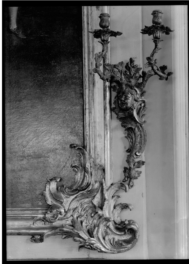
Abb. 3, Johann August Nahl d.Ä. (Entwurf), Wandbranze Modell „Zephir“, Potsdam, Stadtschloss, Ovales Speisezimmer, R. 11, Berlin/Potsdam von 1742 bis 1769, Bronze (Messing), feuerversilbert, 57 x 37 x 17 cm, Aufnahme 1942/44. Foto-Inventarnr: F0000857