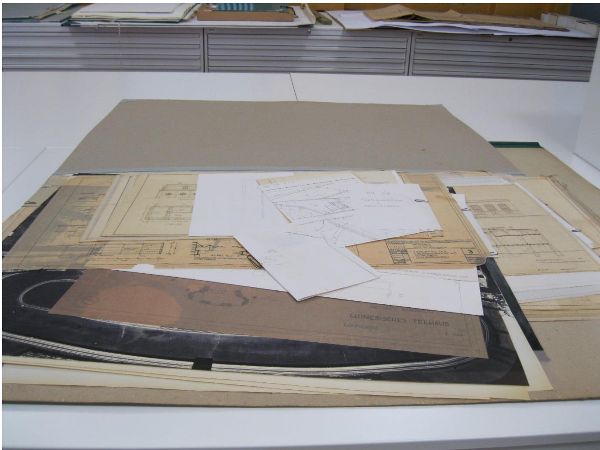
Abb. 1, Zustand der Mappen vor Projektbeginn.

Im Fachbereich Dokumentation der Stiftung Preußische Schlösser und Gärten Berlin-Brandenburg (SPSG) wird eine Plansammlung betreut, die gegenwärtig einen Umfang von mehr als 16.000 großformatigen Architektur-, Garten- und Leitungszeichnungen besitzt. 1 Davon kamen nach dem Umzug des Fachbereichs in den 2017 fertiggestellten Archivneubau auf dem Gelände des Wissenschafts- und Restaurierungszentrums (WRZ) der Zimmerstraße in Potsdam ca. 8.500 Pläne hinzu. Dieser neue Bestand konnte bis Ende 2017 auf nun lange Zeit gesichert werden. Das war nicht zuletzt durch die umfangreiche Mitwirkung von Friederike Hausmann, Sarah Michel und Julia Geiger, die im Rahmen eines Bundesfreiwilligenjahres bzw. als Praktikantin für Archivwissenschaften in der Plansammlung für dieses Projekt tätig waren, möglich.