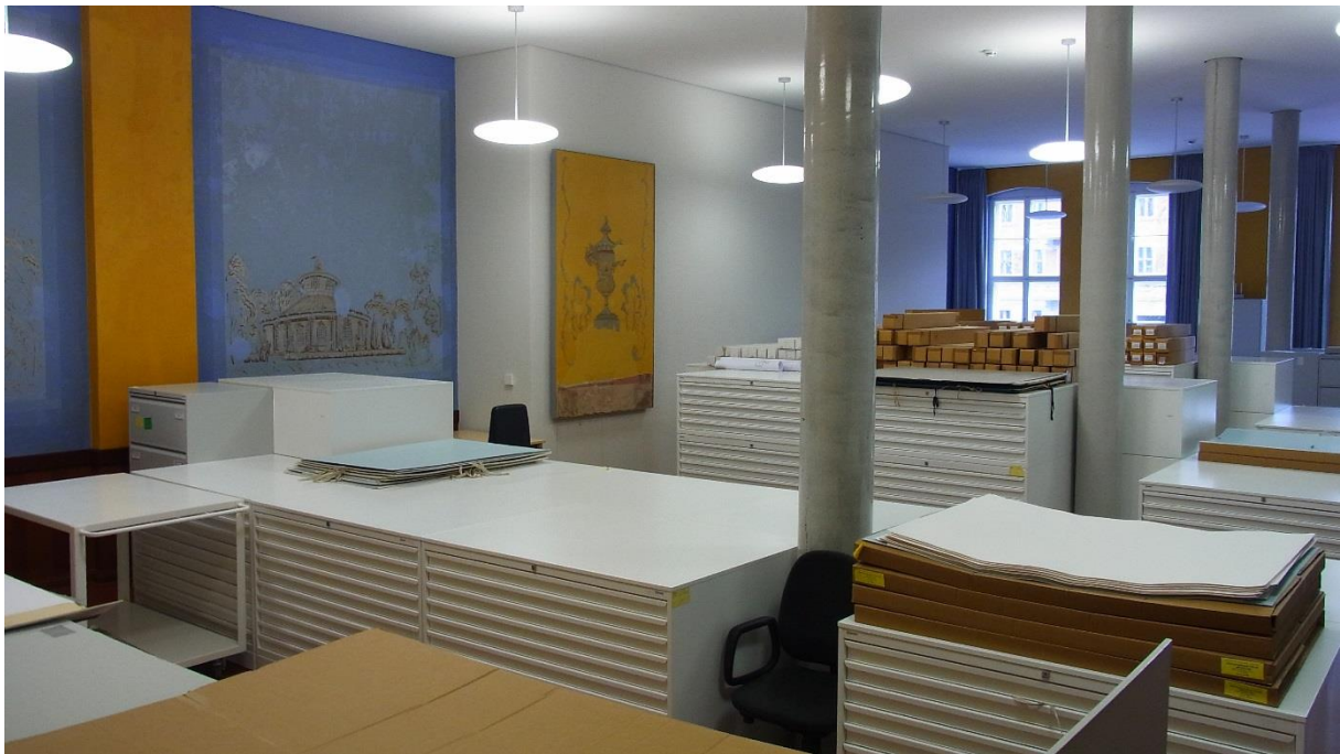
Abb. 4, Plansaal der SPSG

Eine große Anzahl Schwarz-Weiß-Kopien von Grafiken und historischen Plänen stammt aus der Grafischen Sammlung der Stiftung, in der die Originale aufbewahrt werden und die neben Fotos und Messbildern als eine Arbeitsgrundlage für die Bau- und Restaurierungsmaßnahmen dienen.