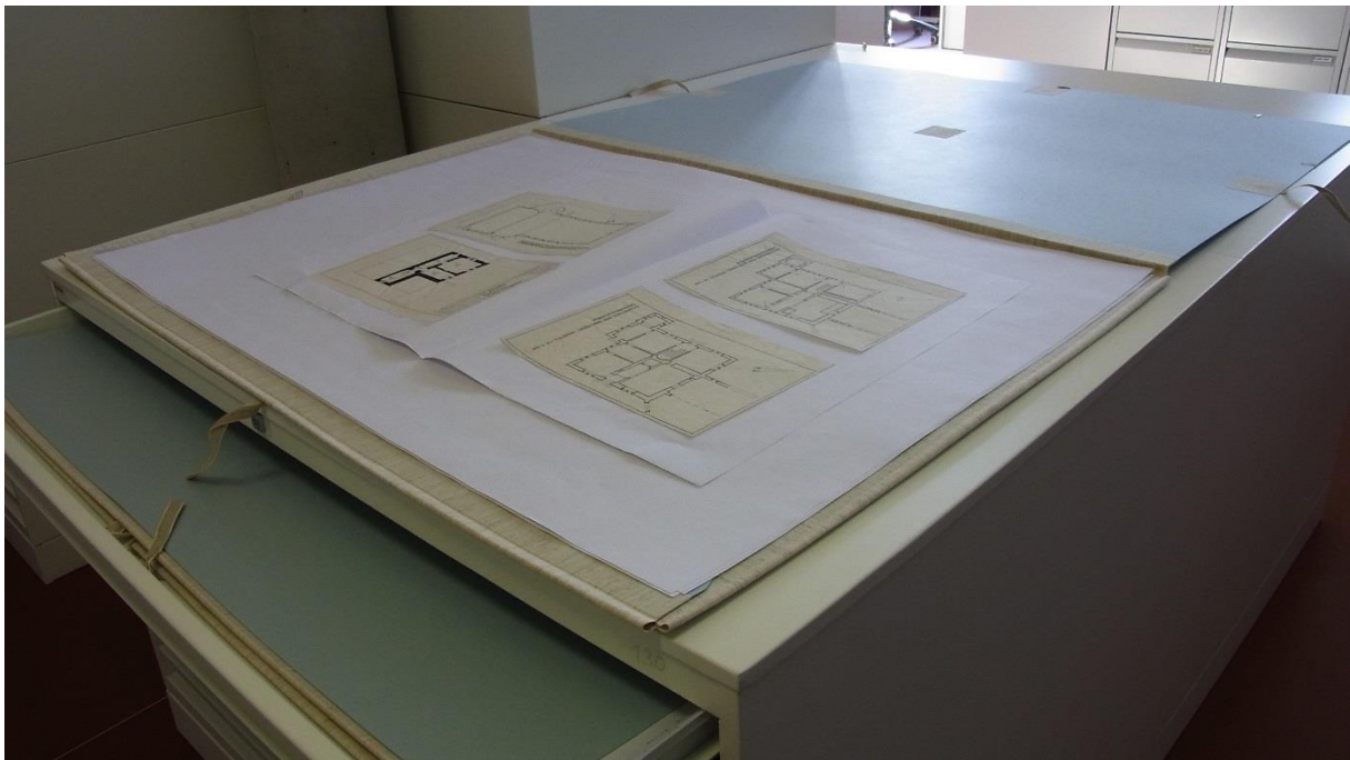
Abb. 2, Mappen, Pläne, Zwischenlagepaier, Foto: SPST

Im August 2017 wurden die ersten Schutzverpackungen geliefert. Am Ende des Projektes betrug deren Zahl mehr als 450 Mappen und 3.500 Bögen Zwischenlagepapier. Bevor mit dem Ordnen des neu zugegangenen Bestandes begonnen werden konnte, erfolgte zeitgleich mit der Sichtung des Konvoluts eine Recherche zu vergleichbaren Projekten, um daraus unter konservatorischen Gesichtspunkten geeignete Strategien im Umgang mit der eigenen Sammlung zu entwickeln. Außerdem wurde für die Erfassung der Schäden eine geeignete Schadenskartierung entwickelt.