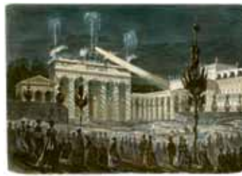
„Das Triumphfest in Berlin - Die Illumination des Brandenburger Tores am Abend des 16. Juni 1871“. Farbiger Holzstich nach einer Zeichnung von E. Wilberg | bpk, Bild Nr. 00003656.

Mit der Gründung des „zweiten deutschen Kaiserreiches“ wurde die tiefe Sehnsucht einer Mehrheit der Deutschen nach einem eigenen Nationalstaat Wirklichkeit. Doch aller Anfangs-euphorie zum Trotz: alte Probleme blieben, neue taten sich auf. Ausgehend vom Ringen der preußischen Herrscher um eine neue Identität in ihrer Rolle als deutsche Kaiser und Könige von Preußen werden in insgesamt acht Vitrinen gesellschaftliche Entwicklungen und Konflikte in Preußen, überwiegend aus der Zeit nach 1871, thematisiert. Wirtschaftlicher Aufschwung und Gründerkrach, die Forcierung des Mietskasernenbaus mit seinen gravierenden sozialen und politischen Folgen, die herausragende Stellung des Militärs in der Gesellschaft, der Akademisierungsprozess staatlicher und privater Forschungsinitiativen, der Kulturkampf im Spiegel der preußischen Gesetzgebung und Aspekte des gründerzeitlichen Historiendramas stehen im Mittelpunkt der Präsentation und Kommentierung ausgewählter Schlüsselquellen aus den Beständen des GStA PK, die hier erstmals präsentiert werden.