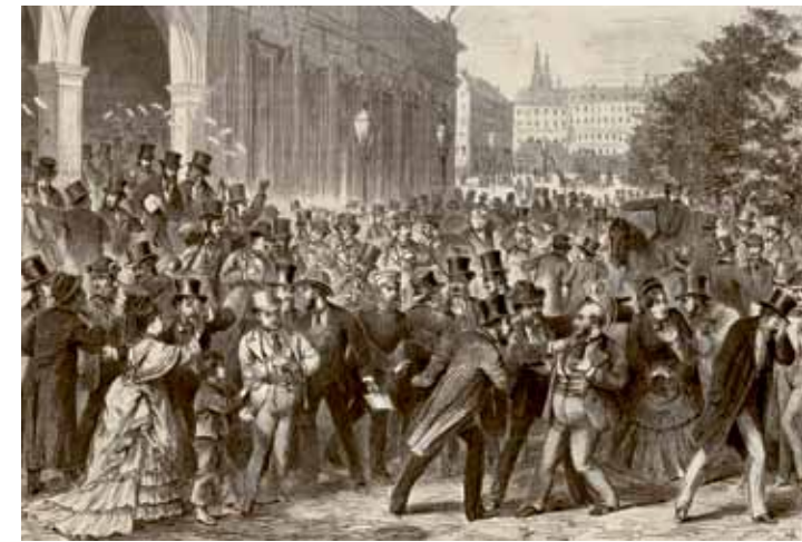
Die Börsenkatastrophe in Wien am 9. Mai 1873. Nach einer Skizze von J. E. Hörwarter. Illustrierte Zeitung, Leipzig, Berlin u.a., 60. Jahrgang, Nr. 1564, 21. Juni 1873, S. 472.