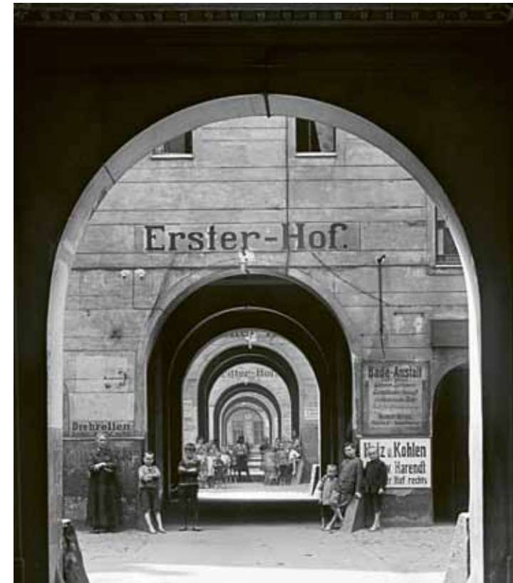
Blick in die sechs Höfe der Mietskaserne „Meyer's Hof“ in der Ackerstraße im Wedding. Berlin, 1910.