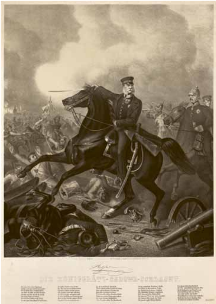
Wilhelm I. in der Schlacht von Königgrätz-Sadowa (3.7.1866).