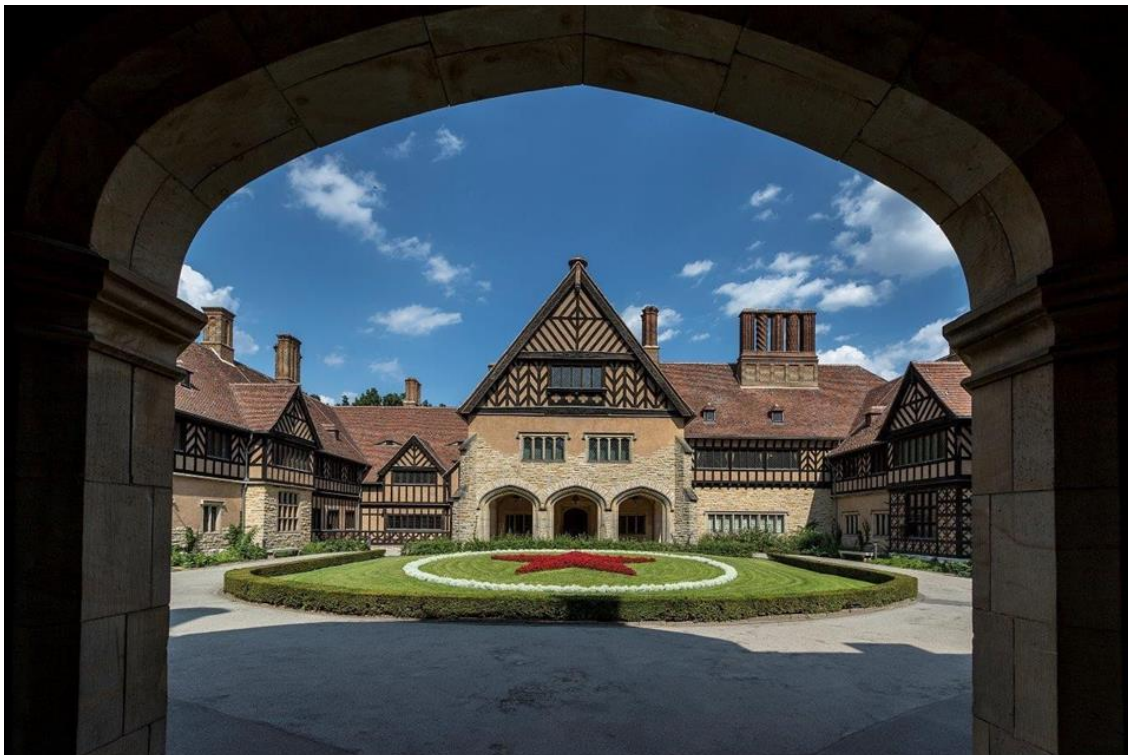
Abbildung 1 Schloss Cecilienhof, Blick in den Ehrenhof mit gepflanztem Sowjetstern

Als am 17. Juli 1945 der sowjetische Generalissimus Josef Wissarionowitsch Stalin, der britische Premierminister Winston Churchill und der amerikanische Präsident Harry S. Truman die große Halle im Schloss Cecilienhof in Potsdam betraten, wurden sie von einem Blitzlichtgewitter der Fotografen empfangen. Seit Anfang Mai schwiegen die Waffen, der Zweite Weltkrieg in Europa war vorüber, während der Krieg in Asien gegen das japanische Kaiserreich mit unverminderter Härte fortgeführt wurde. Nun schaute die Welt auf das mit Spannung erwartete Zusammentreffen der Großen Drei, diesen „... einzigen Augenblick, der alles bestimmt und alles entscheidet“: „Ein einziges Ja, ein einziges Nein, ein Zufrüh oder ein Zuspät macht diese Stunde unwiderruflich für hundert Geschlechter und bestimmt das Leben eines Einzelnen, eines Volkes und sogar den Schicksalslauf der ganzen Menschheit. Solche dramatisch geballten, solche schicksalsträchtigen Stunden, in denen eine zeitüberdauernde Entscheidung auf ein einziges Datum, auf eine einzige Stunde und oft nur eine Minute zusammengedrängt ist, sind selten im Leben eines Einzelnen und selten im Laufe der Geschichte.“ 1