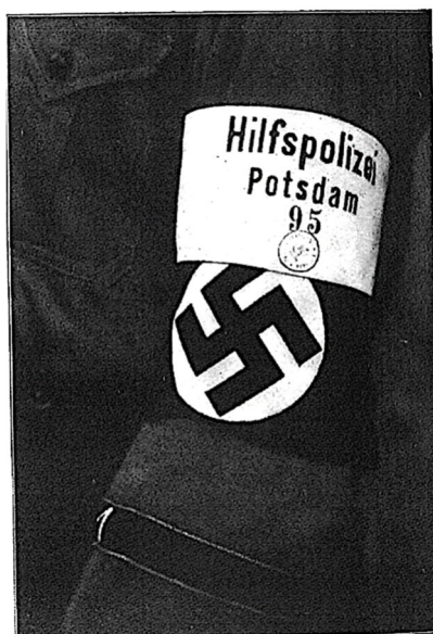
Abb. 5: Armbinde für SA- und SS-Angehörige im Polizeihilfsdienst, Foto: Archiv des Autors, Foto: Archiv des Autors, Bildbearbeitung: Philipp Henkelmann.

Dann brannte fünf Tage später, am 27. Februar, der Reichstag. Für das Feuer wurden die Kommunisten verantwortlich gemacht – und schon am nächsten Tag trat die von den Nationalsozialisten formulierte „Verordnung des Reichspräsidenten zum Schutz von Volk und Staat“ zur „Abwehr kommunistischer staatsgefährdender Gewaltakte“ in Kraft. Sie verfolgte – in der Sprache der Machthaber – „Verrat am deutschen Volk und hochverräterische Umtriebe“. Bis März wurden daraufhin rund 7500 Kommunisten verhaftet. Auch nahm die „Reichstagsbrandverordnung“ den Länderregierungen des Reichs, wie argumentiert wurde, die Möglichkeit, „die Maßnahmen der Reichsregierung zu sabotieren“. Denn behauptete die