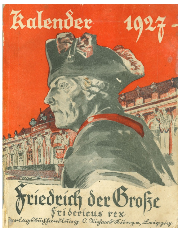
Abb. 6: Cover des Kalenders Friedrich der Große 1927, Foto: Archiv des Autors.

1 Mark 40 erhältlich. 18 Auch die Ausgabe für das Jahr 1927 führte noch diese umständliche Bezeichnung; sie war 1926 ebenfalls in Leipzig, nun aber im Verlag C. Richard Kunze veröffentlicht worden. Für den 1928 erscheinenden dritten Jahrgang änderten sich bis zu seiner Einstellung 1934 der Name, der Verlag und der Druckort des Jahrbuchs. Nun lautete sein Titel: Friedrich der Große (Fridericus rex). Ein vaterländisches Jahrbuch für jede echt deutsche Familie, insbesondere für die vaterländischen Verbände und Vereine und gedruckt wurde es im Vaterländischen Verlag in Halle an der Saale. Es kostete nun nur noch 1 Mark.