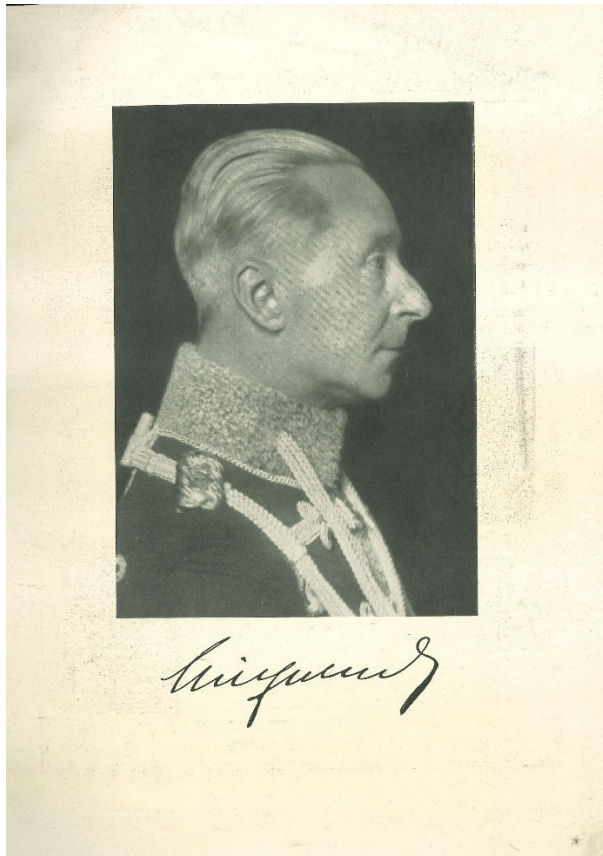
Abb. 2: Foto des Exkronprinzen Wilhelm im vaterländischen Jahrbuch Friedrich der Große 1934, Foto: Archiv des Autors.

deutsche Volk in dieser Zeit, wie er schrieb, auf den Weg des „Wiederaufstiegs aus tiefem Sturz“ und „aus Not und Knechtschaft zu neuem Ansehen, neuer Kraft [und] neuer Freiheit“. Was veranlasste den Exkronprinzen, dieses festzustellen, zu denken und zu schreiben? Was war in diesen fünf Monaten von Ende Januar bis fast Ende Juni 1933 geschehen, dass ihn zu dieser Überzeugung kommen ließ?