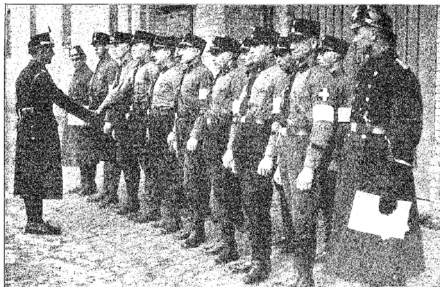
Abb. 4: Verpflichtung neuer Hilfspolizisten (SS), Foto: Archiv des Autors, Bildbearbeitung: Philipp Henkelmann.

geführt. Tatsächlich konnte Göring die Ziele der Partei nun legal und mit unbeschränkter polizeilicher Gewalt durchsetzen.