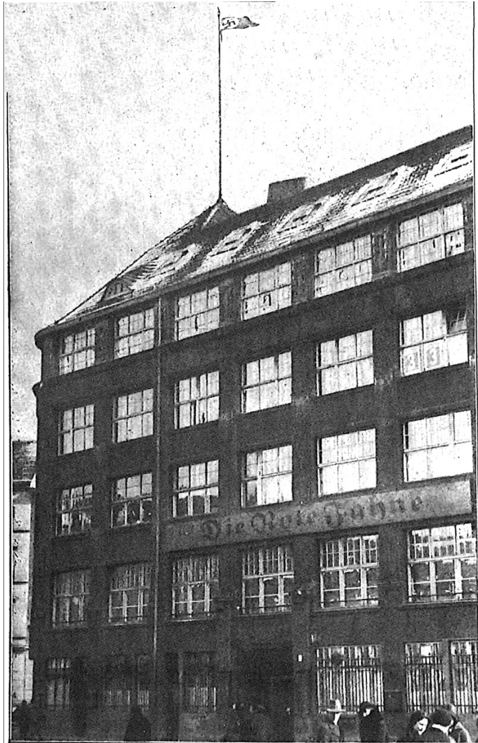
Abb. 3: Nach der Besetzung durch die SA wehte Hakenkreuzfahne auf dem "Liebknechthaus", Foto: Archiv des Autors, Bildbearbeitung: Philipp Henkelmann.

der Folge wurde am 26. Februar das Karl-Liebknecht-Haus, die Parteizentrale der KPD, geschlossen. Am 8. März wurde sie durch SA-Männern besetzt und in Horst-Wessel-Haus umbenannt, nach dem Berliner SA-Sturmführer, den die Nationalsozialisten zum „Märtyrer der Bewegung“ gemacht hatten.